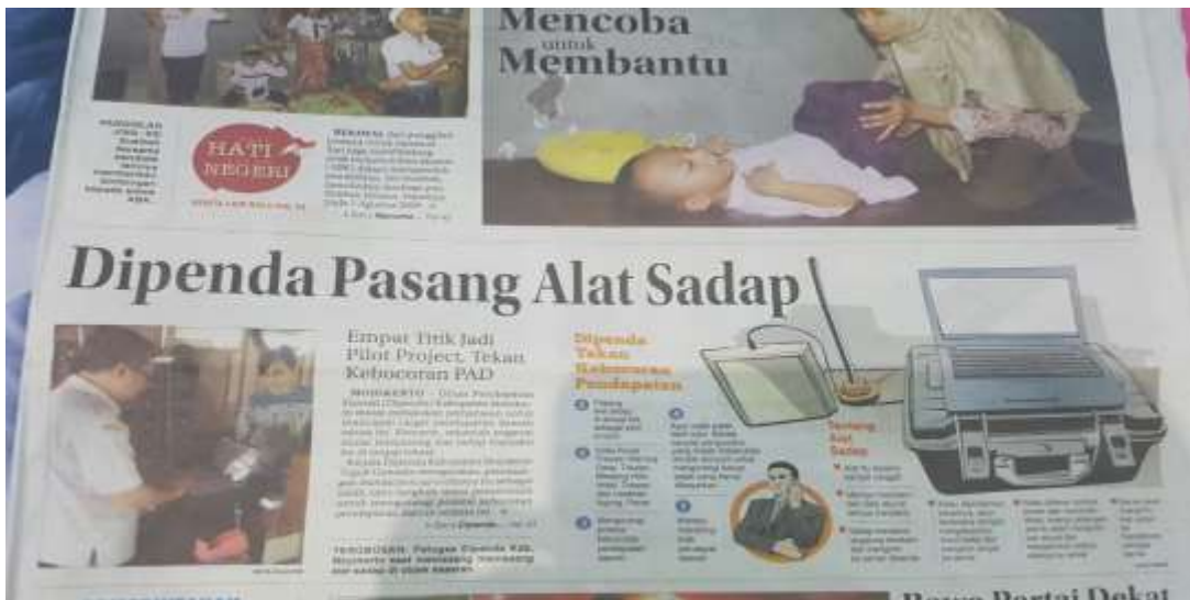
Berita pemasangan perangkat tapping box di media cetak

Monitoring implementasi operasional perangkat Si-TaBo ”