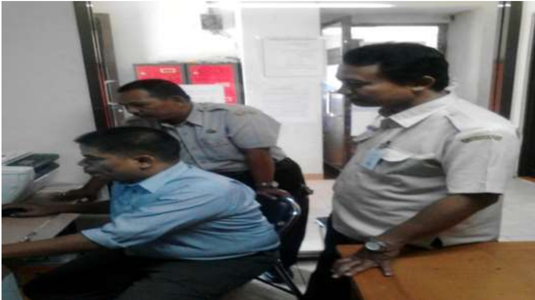
Monitoring di Hotel Blessing Hills Trawas