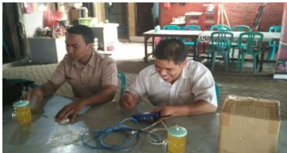
Pemasangan tapping box di RM. Lesehan Pancingan Agung Pacet