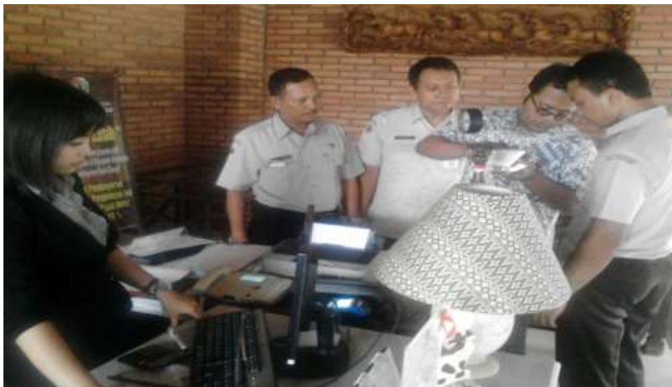
Monitoring di Hotel Royal Trawas & Cottages

Monitoring implementasi operasional perangkat Si-TaBo ”