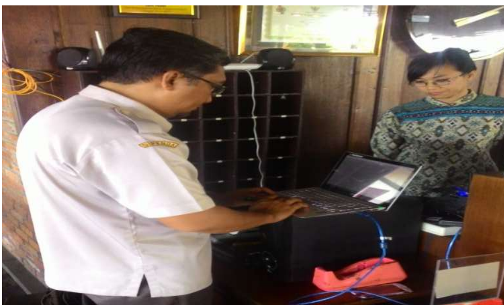
Pemasangan tapping box di RM. Lesehan Pancingan Agung Pacet