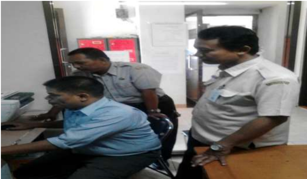
Monitoring di Hotel Blessing Hills Trawas