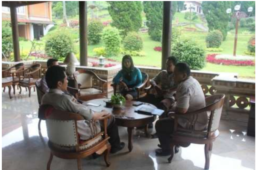
Koordinasi dengan Stakeholders di Royal Trawas Hotel & Cottages Mojokerto