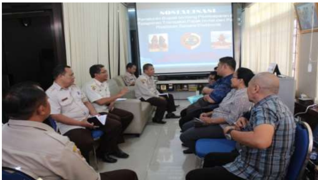
Sosialisasi Peraturan Bupati Nomor 31 Tahun 2016 tentang Pembayaran dan Pelaporan Transaksi Pajak Hotel dan Pajak Restoran Secara Elektronik

Hasil dari sosialisasi tersebut pengusaha hotel dan restoran sebagai sasaran pilot project penerapan sistem pembayaran dan pelaporan pajak hotel dan restoran secara elektronik bisa menerima dan akan membantu kelancaran proses mulai dari pemasangan sampai dengan implementasinya. Hal tersebut didasarkan atas persamaan pemahaman tentang kewajiban fiscus dan pengusaha untuk melaksanakan ketentuan perpajakan sesuai peraturan perundang-undangan, perlunya penggalan potensi sumber-sumber pendapatan bagi pemerintah daerah dan partisipasi pengusaha dalam mendukung pembiayaan pembangunan daerah.