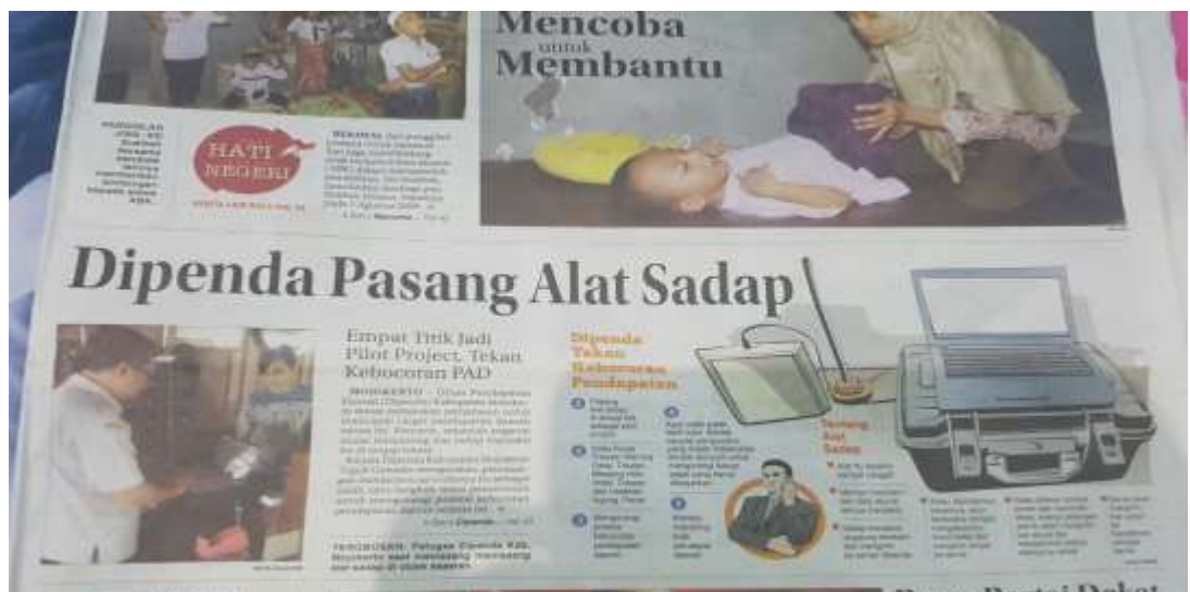
Berita pemasangan perangkat tapping box di media cetak