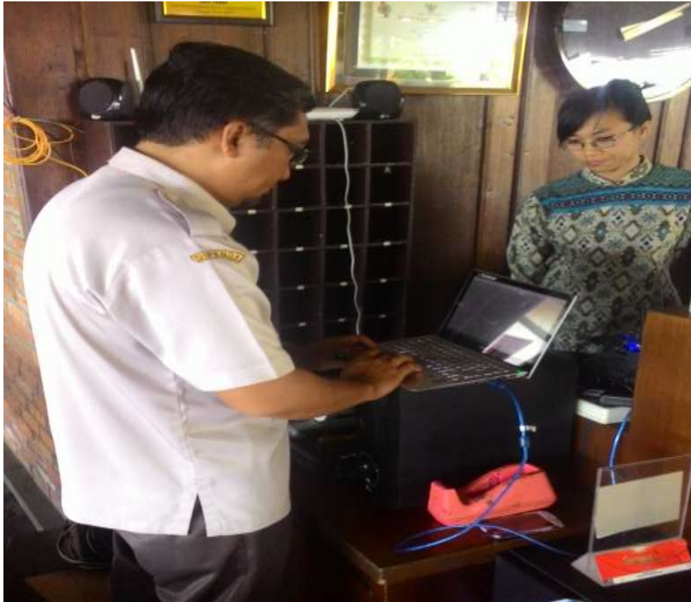
Pemasangan tapping box RM. Waroeng Desa Trawas