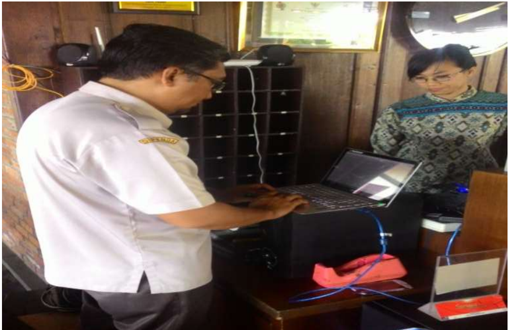
Pemasangan tapping box RM. Waroeng Desa Trawas

Pemasangan tapping box di RM. Lesehan Pancingan Agung Pacet