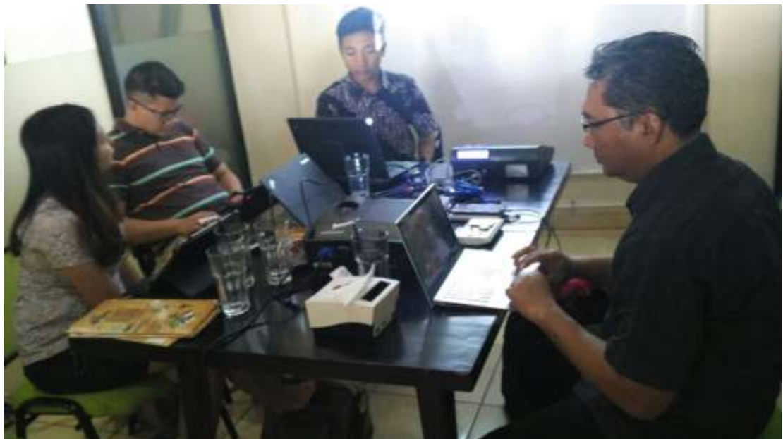
Koordinasi dan pengadaan tapping box di Jakarta

Pada tahap tersebut petugas IT Dinas Pendapatan melaksanakan koordinasi ke Jakarta pada tanggal 2 dan 3 Agustus 2016 untuk mempelajari perihal bisnis proses dan spesifikasi perangkat tapping box sekaligus pengadaannya. Selanjutnya pada tanggal 4 Agustus 2016 Tim Pembahasan Peraturan Bupati melakukan identifikasi, pengumpulan, dan pengolahan data-data terkait Peraturan Bupati tentang Pembayaran dan Pelaporan Transaksi Pajak Hotel dan Pajak Restoran Secara Elektronik dalam rangka sinkronisasi substansi materi regulasi yang mendasari operasionalnya.