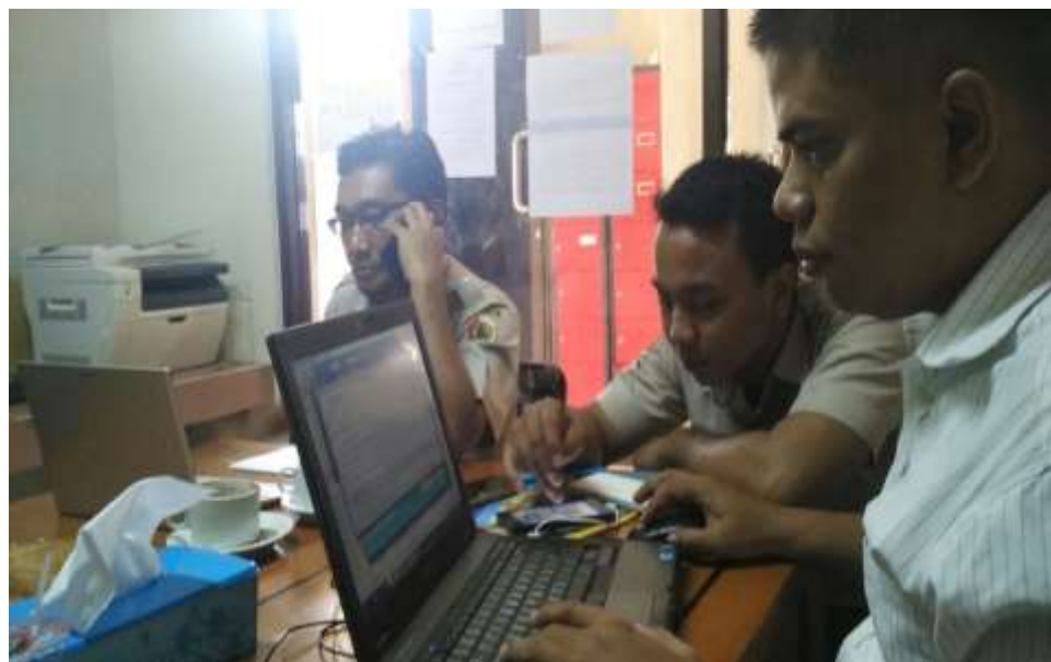
Pemasangan tapping box di hotel Blessing Hills Trawas

Sebelum pemasangan Tapping box terlebih dahulu dilakukan persiapan teknis pemasangan oleh tim yang ditunjuk dengan Surat Perintah Tugas Kepala Dinas Pendapatan Nomor 800/1439/416-115.1/2016 tanggal 8 Agustus 2016 untuk melaksanakan trial operasional. Pemasangan perangkat Tapping box dilaksanakan di 4 (empat) lokasi objek pajak, dengan dilengkapi berita acara pemasangan tapping box yang ditandatangani petugas Dinas Pendapatan dengan wajib pajak sebagai bukti pendukung administrasi penempatan aset Dinas Pendapatan dan sekaligus sebagai bukti pertanggungjawaban pengamanan aset oleh wajib pajak. Dalam Berita Acara Pemasangan tersebut wajib pajak diwajibkan untuk menjaga dan memelihara alat tapping box yang telah terpasang dan akan diberikan sanksi apabila mencoba menghilangkan, merusak, memindahkan atau mematakannya.