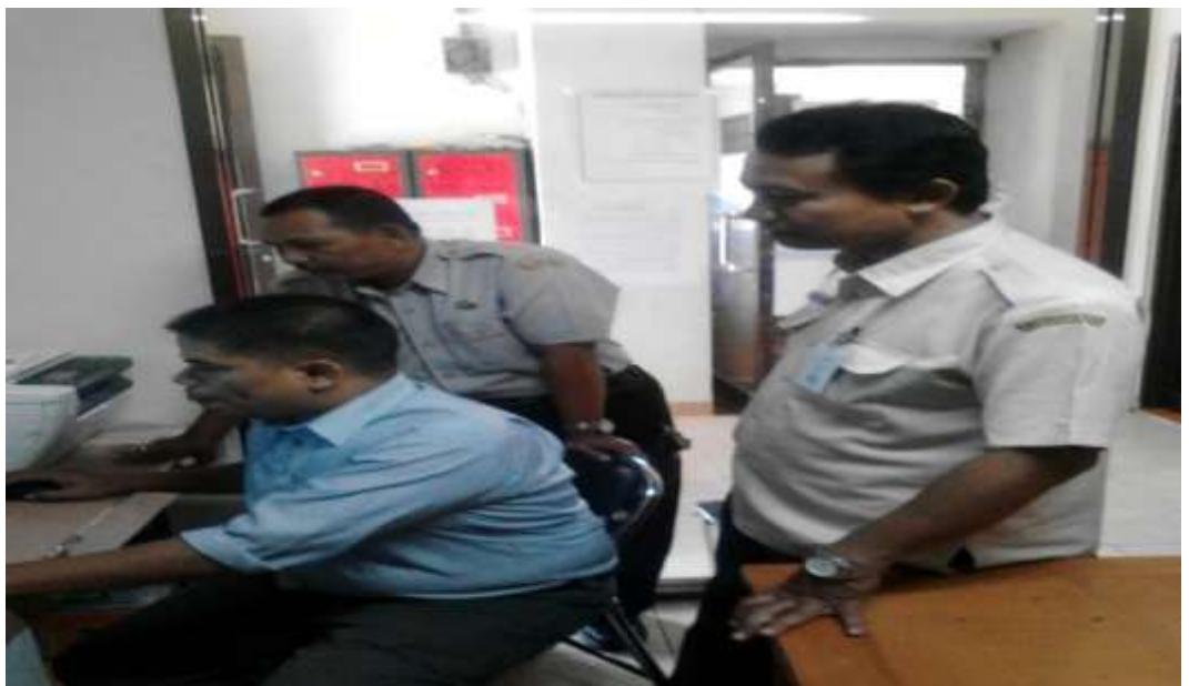
Monitoring di Hotel Blessing Hills Trawas