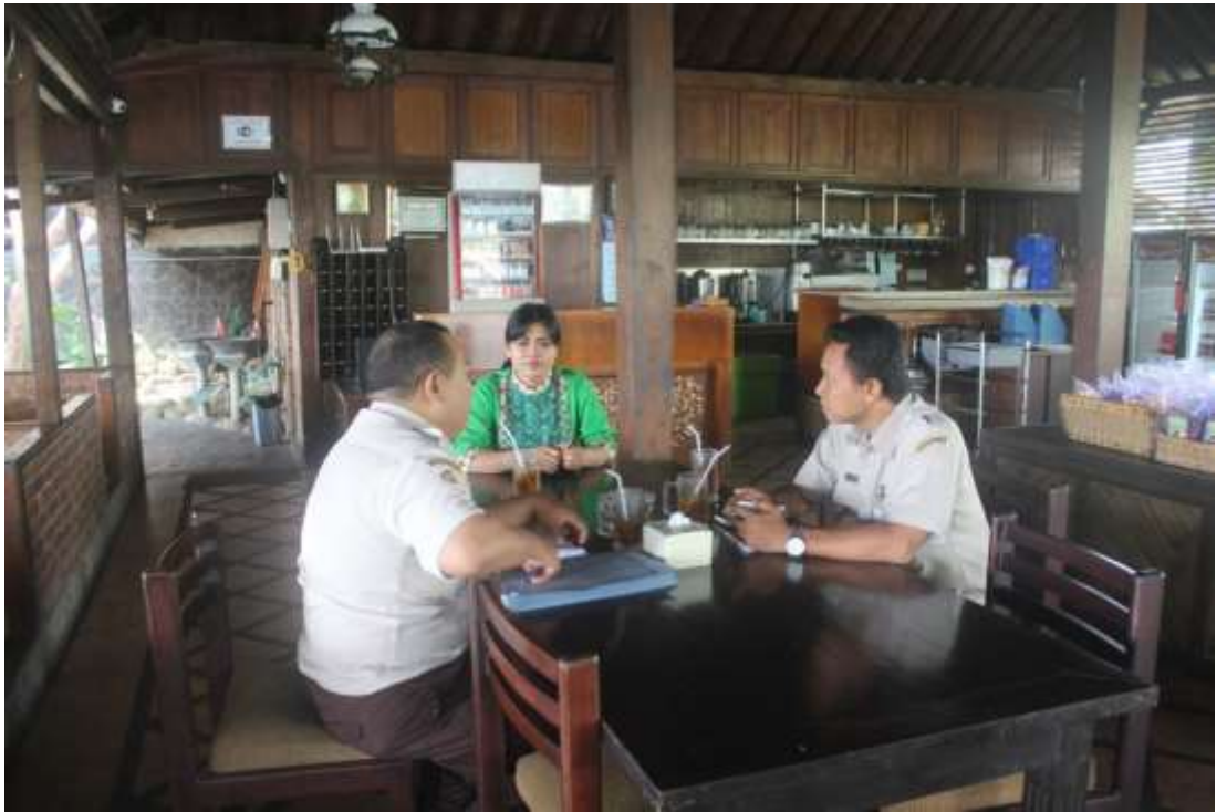
Koordinasi dengan Stakeholders di RM. Waroeng Desa Trawas Mojokerto