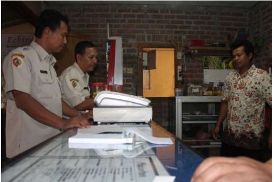
Monitoring di RM. Lesehan Pancingan Agung