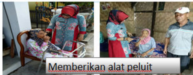
Memberikan alat peluit